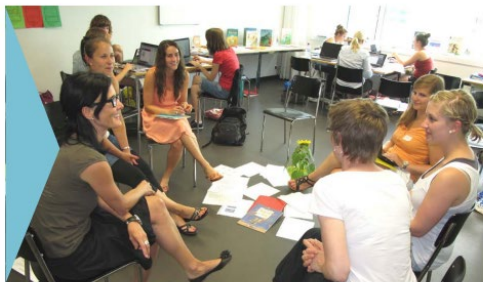
Weiterbildung · Berufsbiografische Angebote · Berufseinstieg