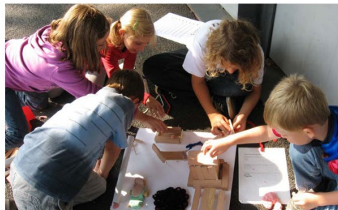
Weiterbildung · Berufsbiografische Angebote · Berufseinführung