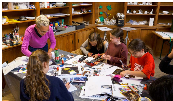
Arbeiten im Künstleratelier

«SORS ermöglicht es uns, umfassende Bildung in unserem Dorf und unserer Umgebung zu stärken.» Reto Häfliger, Schulsozialarbeit Wauwil