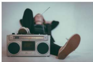
«Wie klingt Liebeskummer im Wandel der Zeit? »